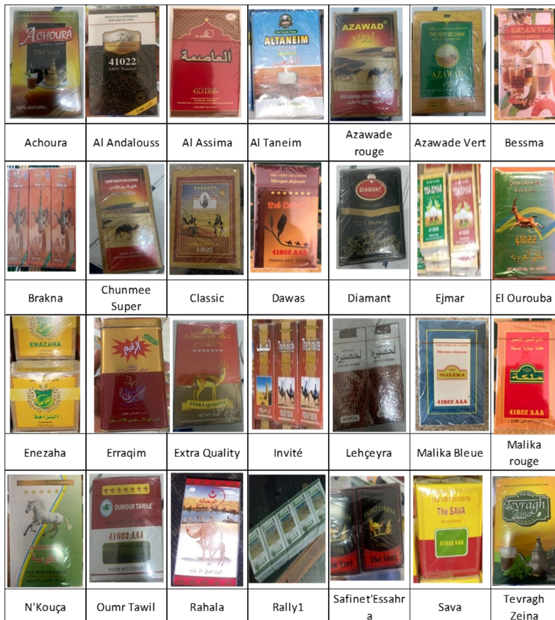
Figure 1 : Marques de thé collectées au niveau des boutiques réparties sur les quatre régions administratives de la capitale Nouakchott, en mars 2021.

La liste est la suivante (voir aussi sur la Figure 1 l'image des différentes marques de ce premier niveau d'échantillons collectés) : Achoura, Al Andalouss, Al Assima, Al Taneim, Azawad Rouge, Azawad Vert, Bessma, Brakna, Chunmee Super, Classic, Dawas, Diamant, Ejmar, El Ourouba, Enezaha, Erraqim, Invité, Lehçeyra, Malika Bleue, Malika Rouge, N'Kouça, Oumr Tawil, Rallye 1, Safinet'Essahra, Sava et Tavragh Zeina.